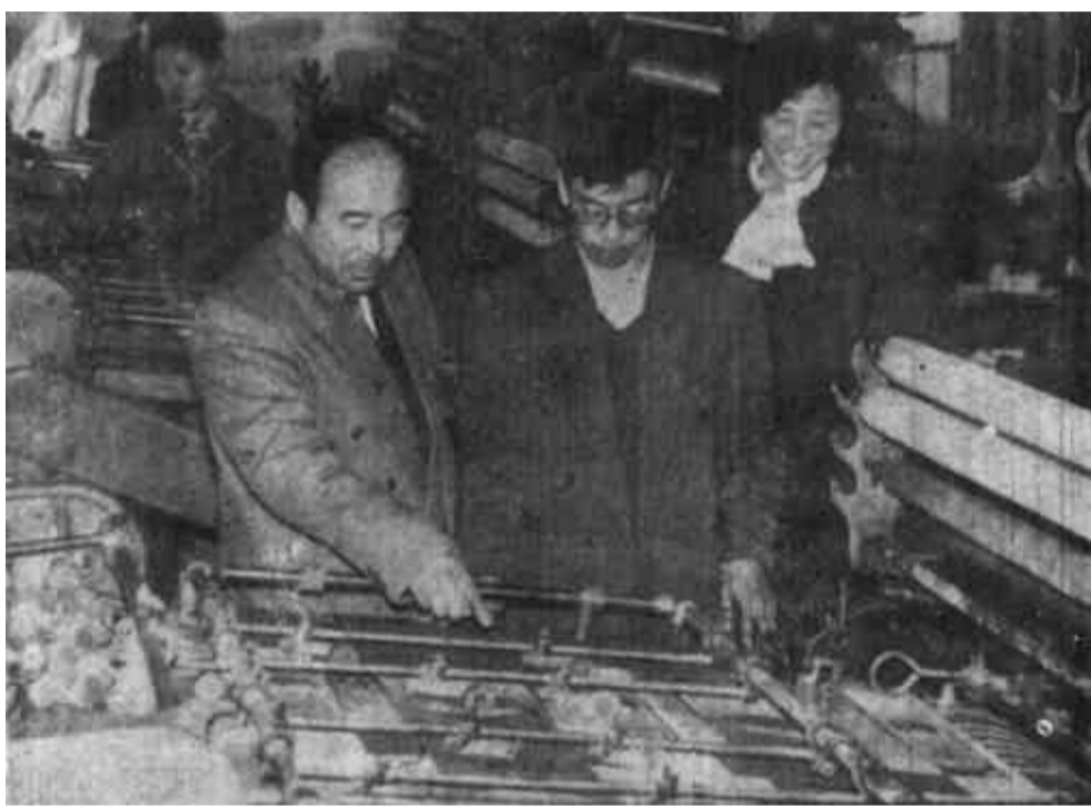
东营市新华印刷厂不为高额利润所诱惑，自觉抵制黄色书刊和非法印刷品，严把印刷出版发行关，每年均有两种以上书刊产品获得部优产品奖，实现了两个文明双丰收。